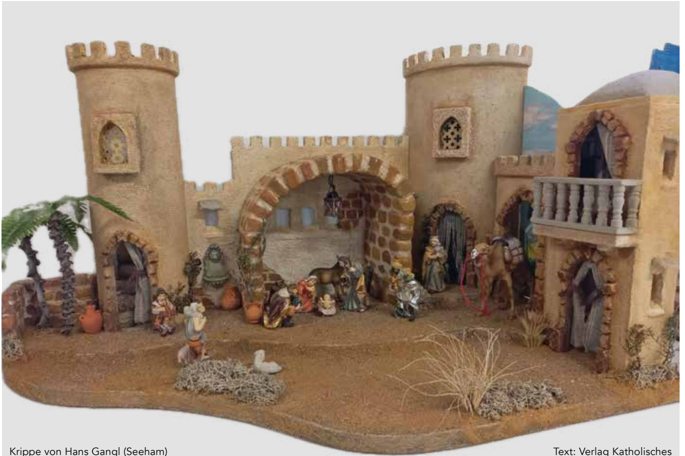
Krippe von Hans Gangl (Seeham)

Text: Verlag Katholisches Bibelwerk GmbH, Stuttgart, 2016