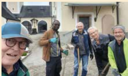
Unkrautreinigung im Friedhof am 28. Oktober 2024. Vielen Dank für die Hilfe.