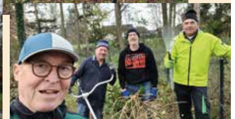
Mittlerweile wurde auch das Winterkleid für unseren Bärenbrunnen aufgebaut und rund um den Pfarrweiher ausgemustert. Vielen Dank an den Pfarrkirchenrat.