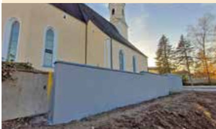
Nach dem Abriss des Metzgerhauses hat die Gemeinde Berndorf die Friedhofmauer wieder ergänzt. Herzlichen Dank für die Errichtung.